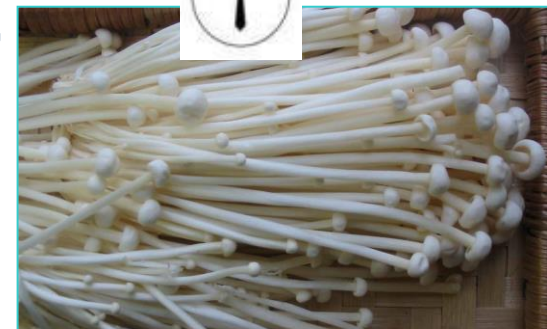
Cultivés sous couvert